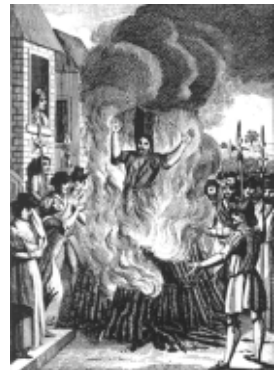
Boston se Puriteine verbrand 'n "ketter."

Ons sal almal die beloning, die krediet ontvang vir die geloof wat ons navolg. Want elke mens se dade – of soos Jakobus sê, sy "werke" – verklap sy geloof. 16