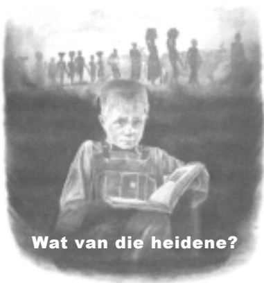
Wat van die heidene?